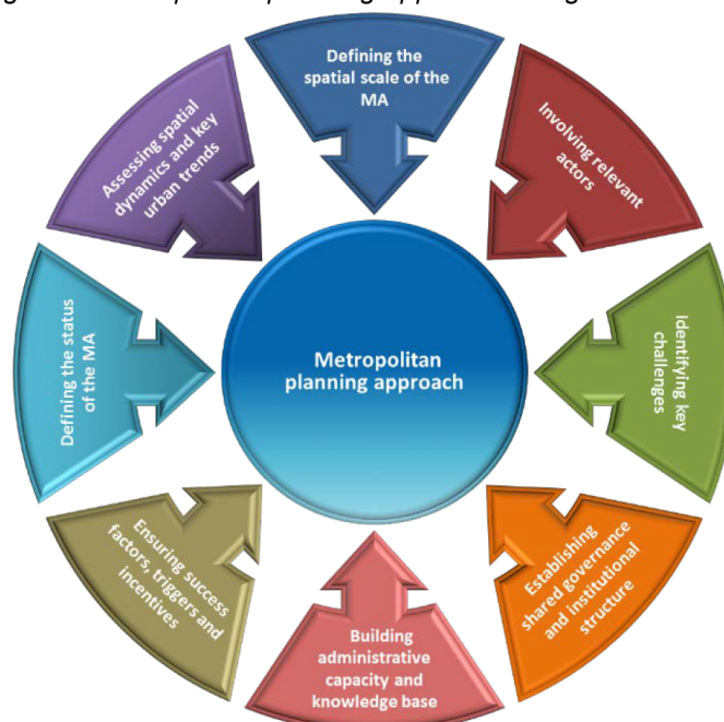
Figure 1. Metropolitan planning approach in eight action areas